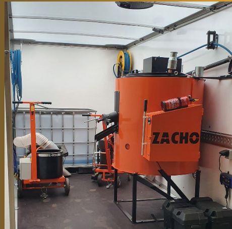
Ausschmelzung von Fugendichtungsmasse oder Thermoplast