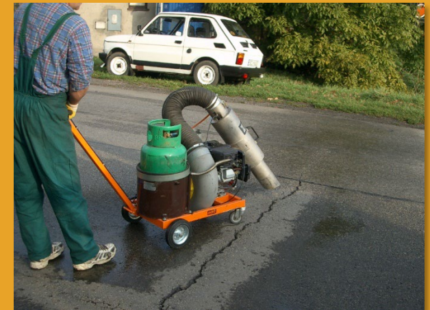
Trocknen/Aufwärmen vor Fugenarbeit & Straßenmarkierung auf Asphalt und Beton