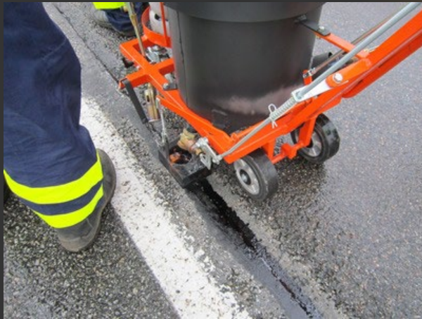
Ausschmelzung von Fugendichtungsmasse oder Thermoplast